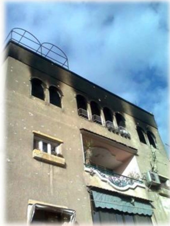
"صور خارجية لأحد الأبنية في مخيم اليرموك"

"بعد اعتقالهم لأربعة أيام الأمن السوري يفرج عن فلسطينيين سوريين عائدين من ليبيا"