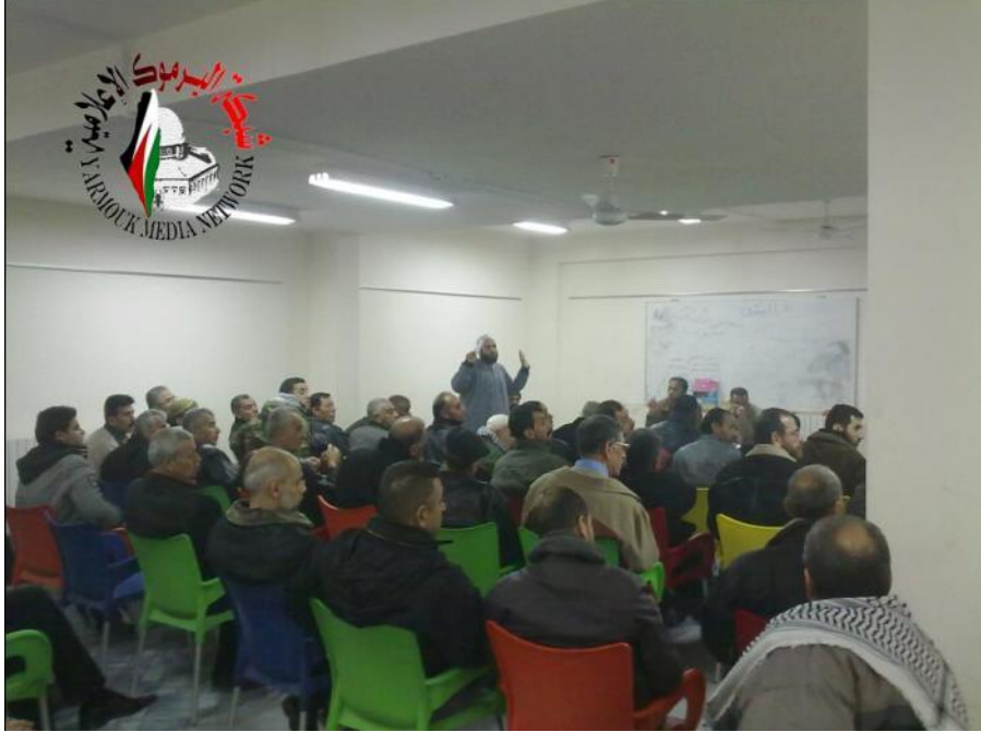
صورة لاجتماع اللجان الشعبية والأهلية وبعض وجهاء مخيم اليرموك

توقف المخابز عن العمل بسبب عدم توفر الوقود ومادة الطحين ما اضطر سكان المخيم للذهاب إلى فرن الزاهرة خارج المخيم لشراء الخبز وهناك يتعرضون للإهانات والنقش والاعتقال والسبب الوحيد في ذلك بأنهم من سكان المخيم. وفي ذات السياق عقدت اللجان الشعبية والأهلية وبعض وجهاء المخيم اجتماعاً بحثت خلاله الحلول المجدية لفك الحصار عن المخيم، وسلطت الضوء فيه على الحاجات الإنسانية والمعيشية لأهل المخيم وضرورة التنسيق بين الهيئات والمؤسسات لتأمين مقومات الصمود والحياة للسكان المتبقين في المخيم.