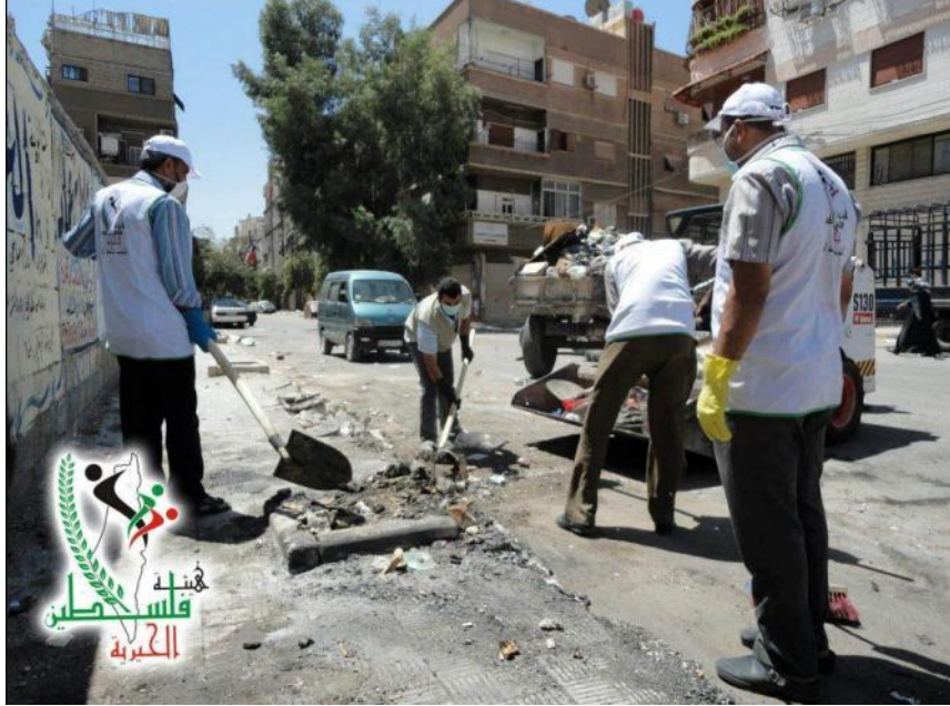
حملة تنظيف بعنوان "نظف مخيمك"

ومن جهتها وزعت الهيئة الخيرية لإغاثة الشعب الفلسطيني في مخيم خان الشيخ، مبالغ نقدية بقيمة 1500 ليرة سورية لرفع المعاناة عن النازحين فيه، حيث بلغ عدد المستفيدين من المساعدة حوالي 270 عائلة نازحة من مخيم اليرموك.