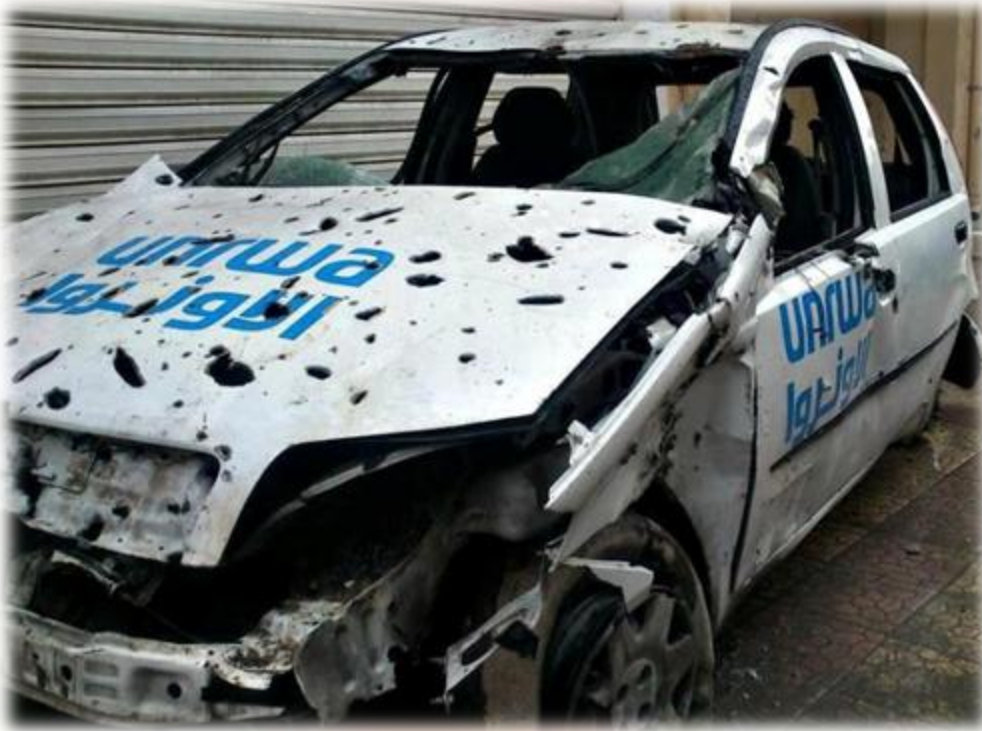
"أحدى سيارات الأنروا في مخيم اليرموك"

"تعرض صحفي فلسطيني من سكان مخيم خان دنون للاختطاف والضرب من قبل مجموعة مسلحة"